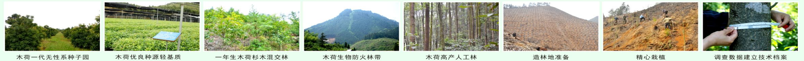
图A.1 木荷用材林培育标准化生产模式图